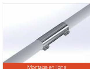
Montage en ligne